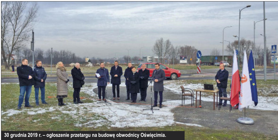
30 grudnia 2019 r. – ogłoszenie przetargu na budowę obwodnicy Oświęcimia.

W grudniu 2019 r. Generalna Dyrekcja Dróg Krajowych i Autostrad ogłosiła przetarg na projekt i budowę obwodnicy Oświęcimia, będącą częścią