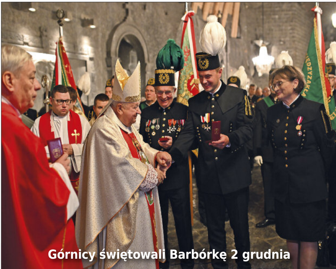
Górnicy świętowali Barbórkę 2 grudnia