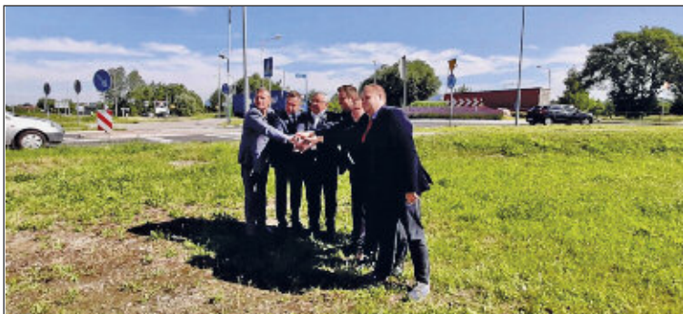
10 lipca 2020 r. – podpisanie umowy na projekt i budowę obwodnicy Oświęcimia w ciągu drogi krajowej nr 44.

– Oświęcim to czwarte pod względem liczby ludności miasto Małopolski, a droga krajowa nr 44 to jego kręgosłup transportowy. Każdego dnia tą trasą porusza się ponad 20 tysięcy aut (zgodnie z danymi Generalnego Pomiaru Ruchu przeprowadzonego w latach 2020-2021). Największe natężenie ruchu odnotowaliśmy na Moście Jagiellońskim na Sole, którym codziennie jeździ 27,5 tys. samochodów. Nowa 9-kilometrowa obwodnica od południa ominie miasto i połączy je z budowaną drogą ekspresową S1 Mysłowice – Bielsko-Biala. Dzięki temu nowa trasa wyprowadzi ruch tranzytowy z centrum miasta i pozwoli na sprawną podróż na południe, w kierunku Beskidów, oraz na północ, do autostrady A4. Na początku 2024 roku skończyliśmy budowę konstrukcji mostu na Wiśle, a w październiku br. zabetonowaliśmy ostatnie elementy północnej jezdni mostu na Sole – informuje Generalna Dyrekcja Dróg Krajowych i Autostrad w Krakowie.