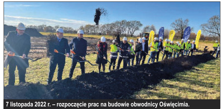
7 listopada 2022 r. – rozpoczęcie prac na budowie obwodnicy Oświęcimia.