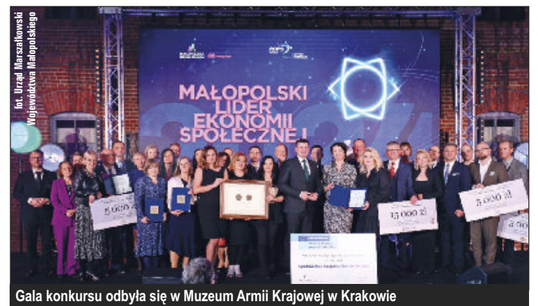
Gala konkursu odbyła się w Muzeum Armii Krajowej w Krakowie

Kopalnia Soli „Wieliczka” już po raz kolejny była partnerem Konkursu Małopolski Lider Ekonomii Społecznej.