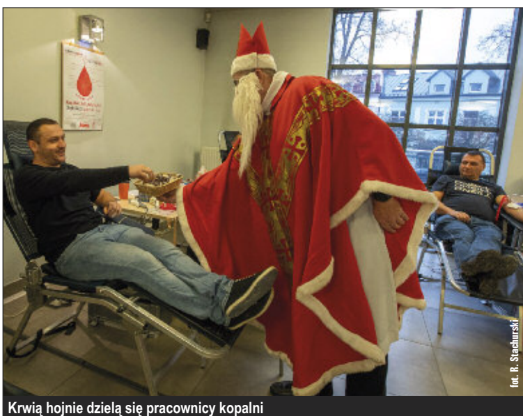
Krwia hojnie dzielą się pracownicy kopalni

Kopalni Soli „Wieliczka” udało się zebrać aż 55,35 litrów krwi od 123 osób. Do nadszycia szybu Regis 5