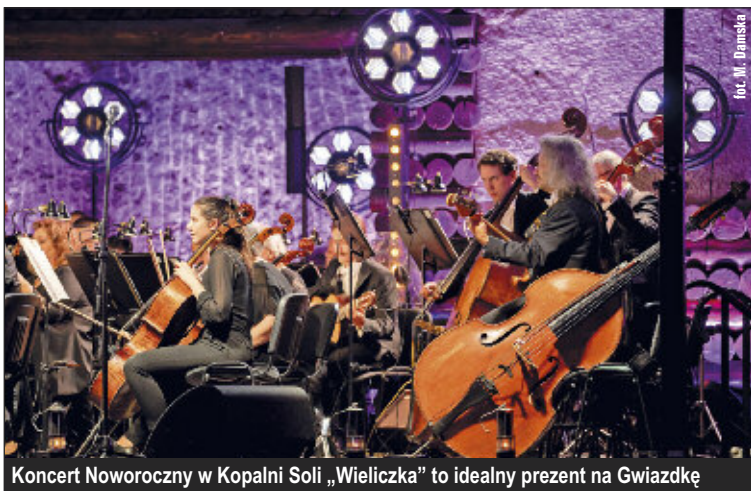
Koncert Noworoczny w Kopalni Soli „Wieliczka” to idealny prezent na Gwiazdkę

3. Smak. Mało kto potrafi oprzeć się słodyczom, a szczególnie czekoladzie. Ta ze szczytą wielickiej soli jest wprost przepyszna. Deserowe tabliczki kuszą dodatkami – słodką maliną, ostrym imbirzem, rozgrzewającym chili, niezwykłą lawendą. Na miłośników czekolady mlecznej czeka wariant z orzeźwiającą posypką limonkową. Słodkości do nabycia w stacjonarnych sklepach kopalni, a także w e-sklepie.