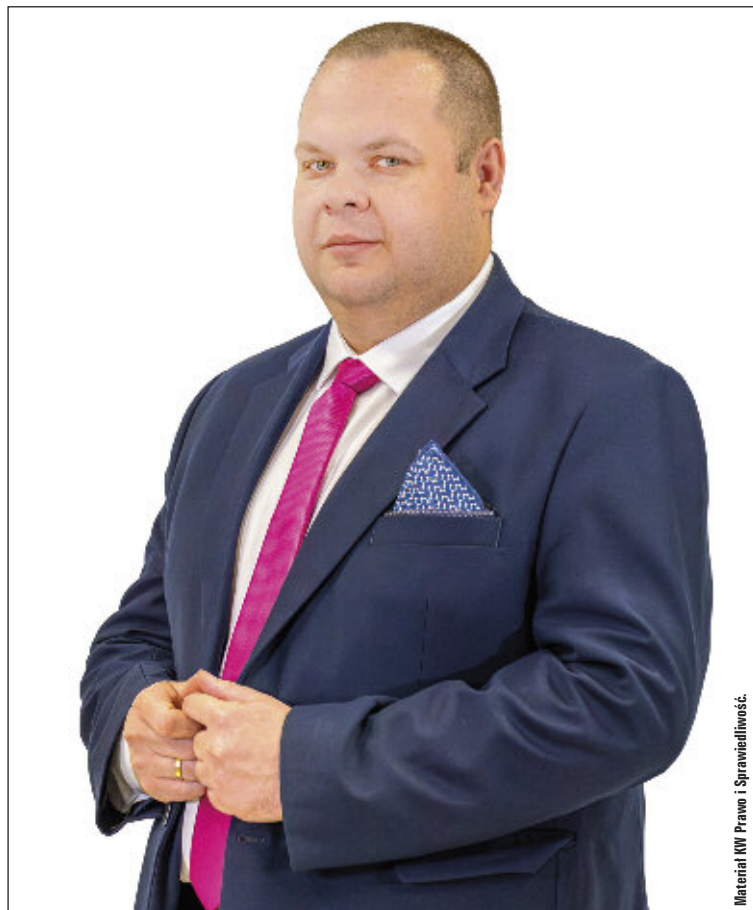
Materiał KW Prawo i Sprawiedliwość.